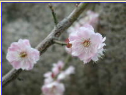
薄いピンクの紅梅