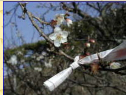
「おみくじ」を梅の枝に・・・