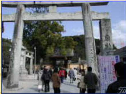
いよいよ境内に入ります。