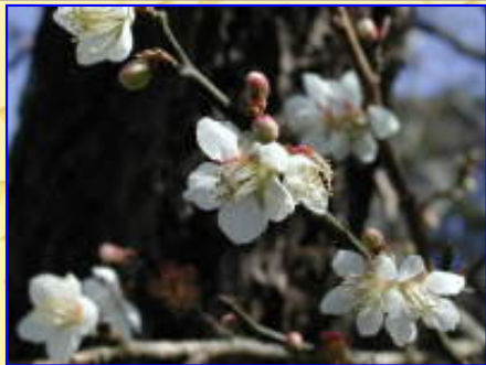
なかなかよい顔の梅でした。