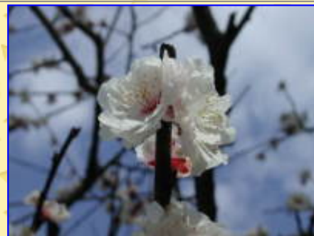
可憐な色合いの梅がきれいだ