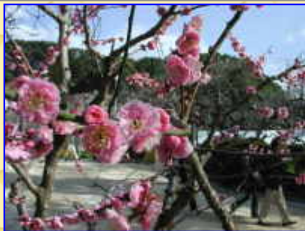
やや散りつつある紅梅