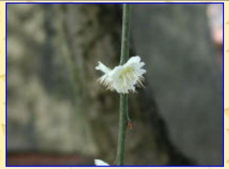
種類がわかりません。