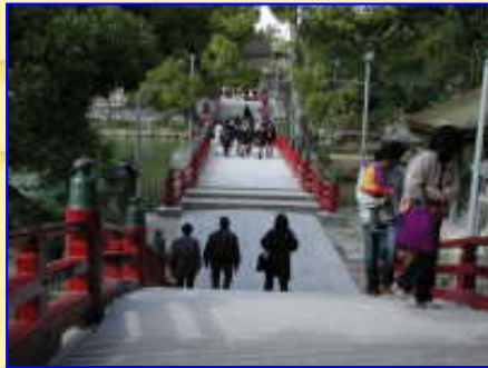
バスツアーで一緒の外人と・・・