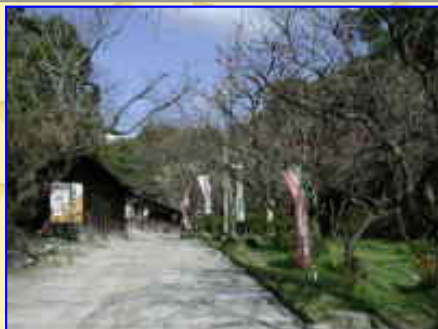
「紅梅」の匂がありました。