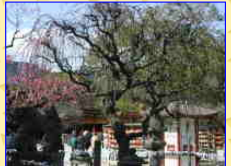
静かな庭園は、情緒たっぷり