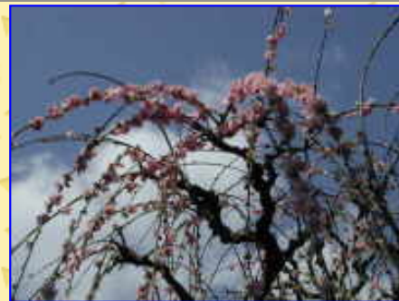
なんと見事にしだれ・・・梅