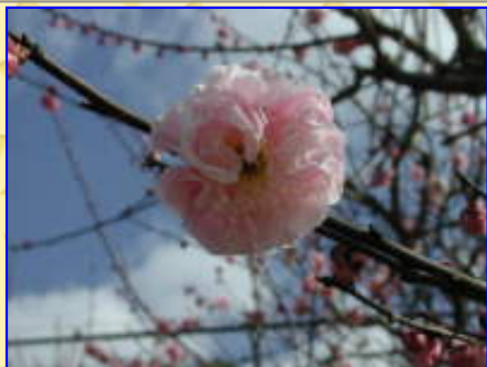
八重梅もここまでくると迫力が・・・