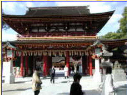
境内の梅はやや散りつつある。