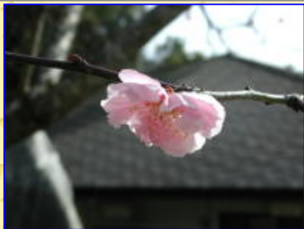
薨をバックに紅梅