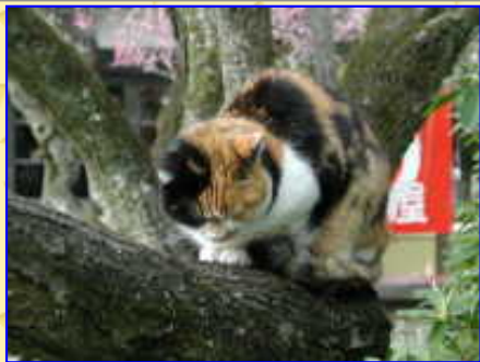
のんびりと昼寝の猫