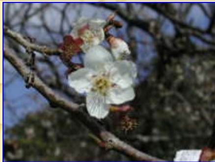
梅の種類がわからないので・・・