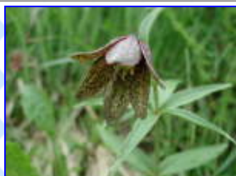
剣沢 8 / 2