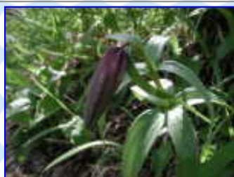
早月尾根 7 / 13