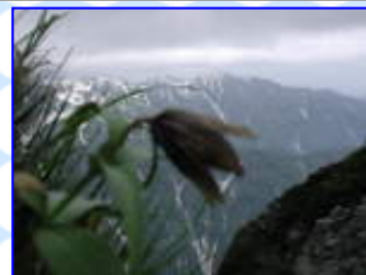
早月尾根 7 / 7