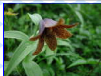
剣沢 8 / 4