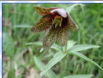
早月尾根 7 / 13