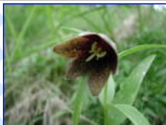
早月尾根 7 / 13