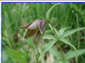
剣沢 8 / 2