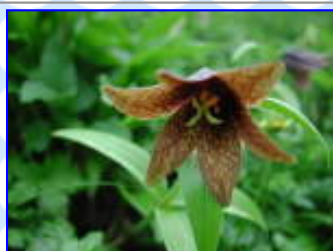
剣沢 8 / 4