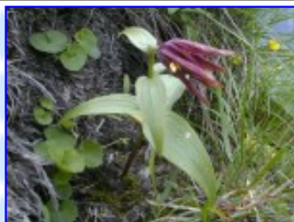
早月尾根 7 / 13