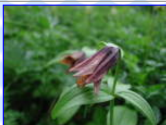
剣沢 8 / 4