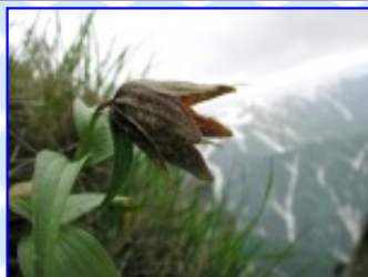
早月尾根 7 / 7