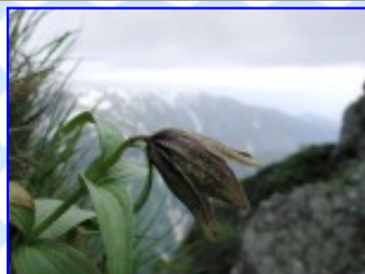
早月尾根 7 / 7