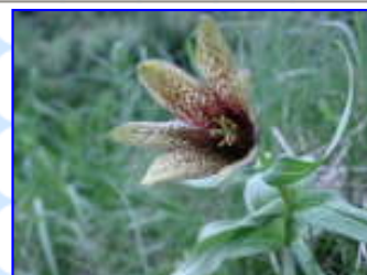
剣沢 8 / 2