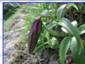
早月尾根 7 / 13