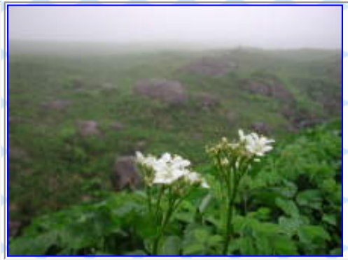
「白木峰」のイワイチョウ