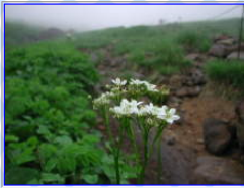
「月山」のイワイチョウ