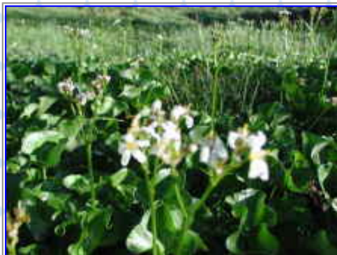
池のほとりの「イワイチョウ」