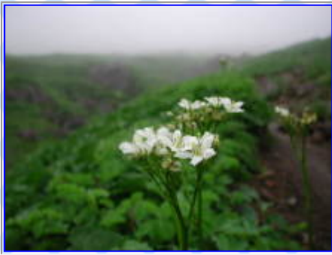
「月山」のイワイチョウ