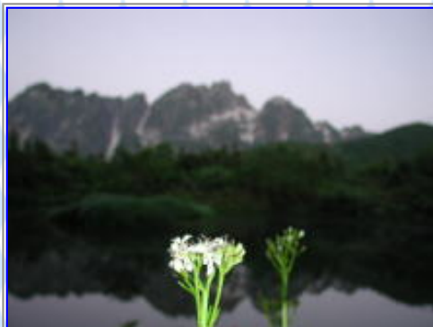
夜明け前、フラッシュで撮影した。