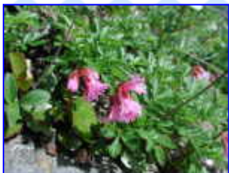
池ノ平山にて仙人池にて