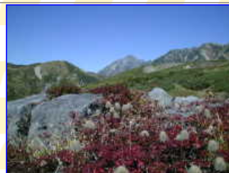
天狗平よりチングルマと剣岳