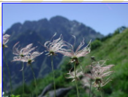
赤谷山より「チングルマと剣岳」