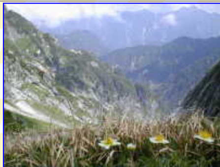
長次郎雪溪の「チングルマと後立山」