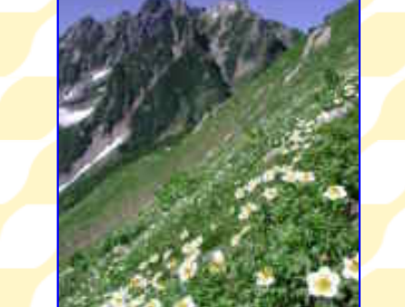
池ノ平山のお花畑