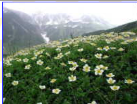
雷鳥沢にて「チングルマと立山」