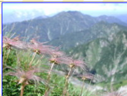
剣岳より「チングルマと毛勝三山」