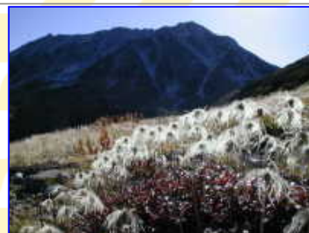
初霜の「チングルマと立山」