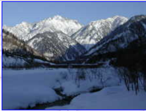
「夕日」を撮影するために、研修センター後の林道へ行きました。