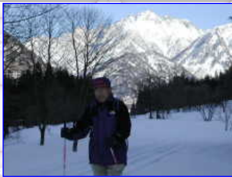
早月川まで降りました、雪質は最高のパウダースノー、まるで北海道の雪原です。