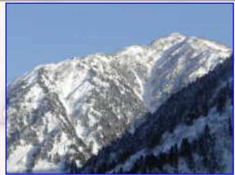
スキーハイクは快適です・・・