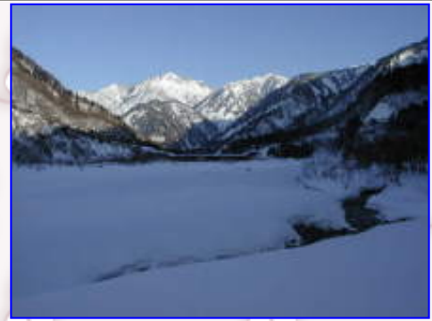
林道からの「剣岳」、しかし、夕焼けがあまり期待できそうにないので・・・