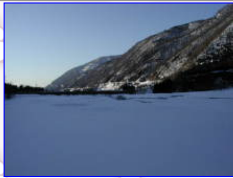
早月川からの剣岳本峰のアップです。