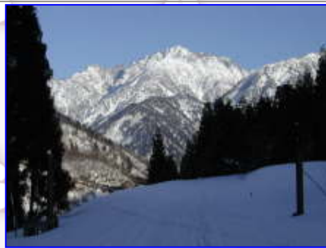
早月川の河原の「雪原」は、好きなところを思い切り、自由に歩ける・・・