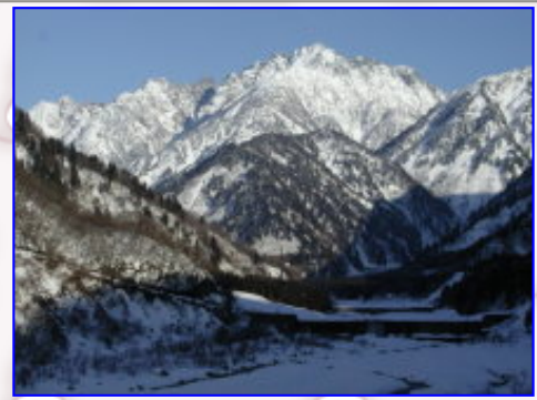
今年は、行きたい「山」・・・クズ八山