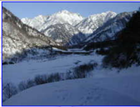
早月川から見た、小窓尾根のアップです。