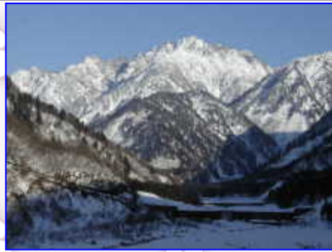
途中であった「大熊山ツアー」への登山者の山スキーの跡です・・・