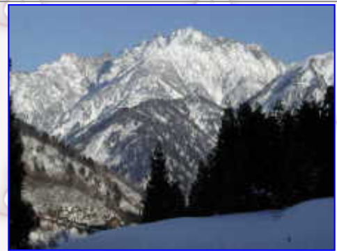
初めてこの河原へ降りたが・・・早月川より「剣岳」、下から見るのも・・・